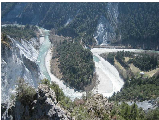
Rheinschleife in der Ruinaalta