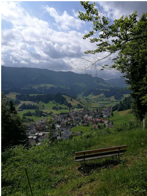
Blick vom Tannengugger auf das Dorf Escholzmatt

Wir haben die Wanderung bei herrlichem Wetter an Fronleichnam (16.06.) rekognosziert. Der Aufstieg zum Bock führt vorwiegend durch den Wald, kurze Abschnitte etwas steil. Stöcke sind für den Auf- und Abstieg empfehlenswert. Falls der Abstieg durch den Wald nach Trub nass ist, wählen wir den Weg ab Risisegg nach Trubschachen (leichter Abstieg, z.T. Asphaltstrasse) Wenn die Züge pünktlich sind, reichen die Umsteigezeiten an den Bahnhöfen gut. Dennoch empfehle ich zügiges Umsteigen.