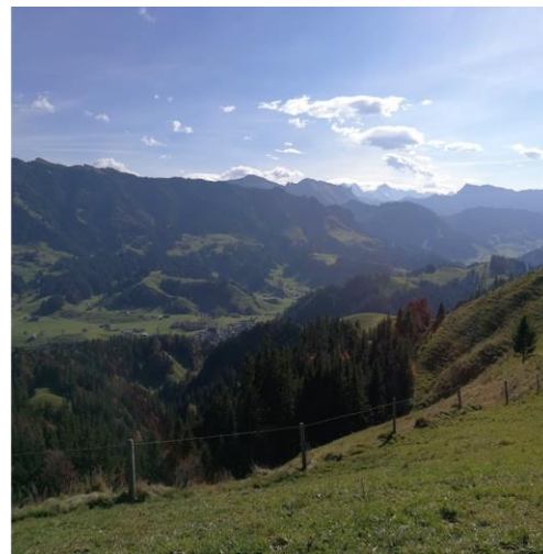
Richtung Berner Alpen