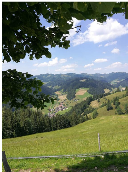
und unterwegs Richtung Trub